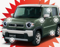
エクスターボディコート